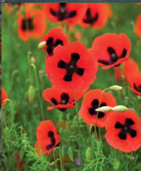
Valmuen vokser vilt i Armenia. Korset inni kan være en fin påminnelse om Treenigheten.

Fjellet Ararat, til høyre på bildet, regnes som et hellig fjell for armenerne. Mange mener at det var her Noah strandet med sin ark. Fjellet ligger nå i Tyrkia.