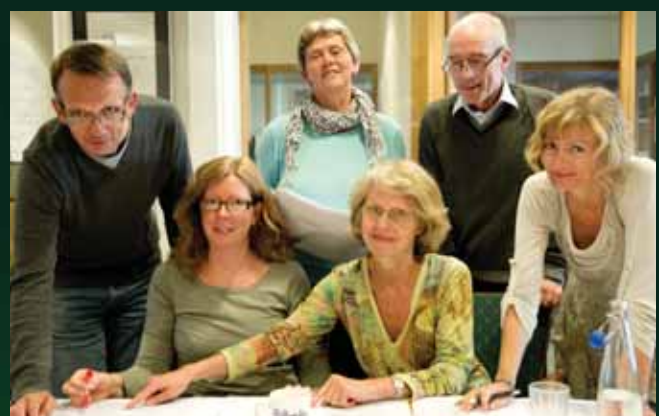
7. Siste korrektur