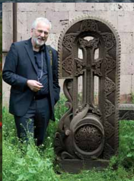
Bibelselskapets Dag Smemo foran bokstaven D i det armenske alfabetet.