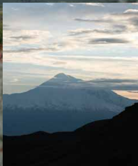
Prestenes hodeplagg er inspirert etter armenernes hellige fjell, Ararat